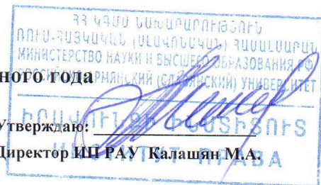
График экзаменационной зимней сессии 2024-2025 учебного года

« ЮРИСПРУДЕНЦИЯ » (магистратура/очная форма обучения)