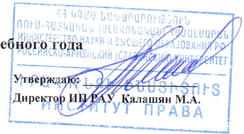
График экзаменационной зимней сессии 2024-2025 учебного года

«ЮРИСПРУДЕНЦИЯ» (магистратура/очная форма обучения)